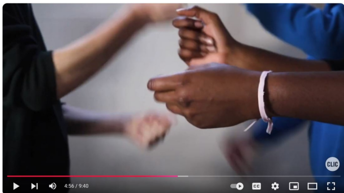
REVOX #1 : MÉMO SONORE OU LES LECTURES REMBOBINÉES

Ateliers de création vocale et visuelle en lycée